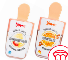
БАЛЬЗАМ для ГУБ