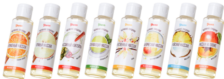
МАСЛО для МАССАЖА