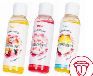
СЪЕДОБНОЕ МАСЛО для МАССАЖА