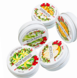
МАССАЖНЫЕ СВЕЧИ НОВОГОДНИЕ